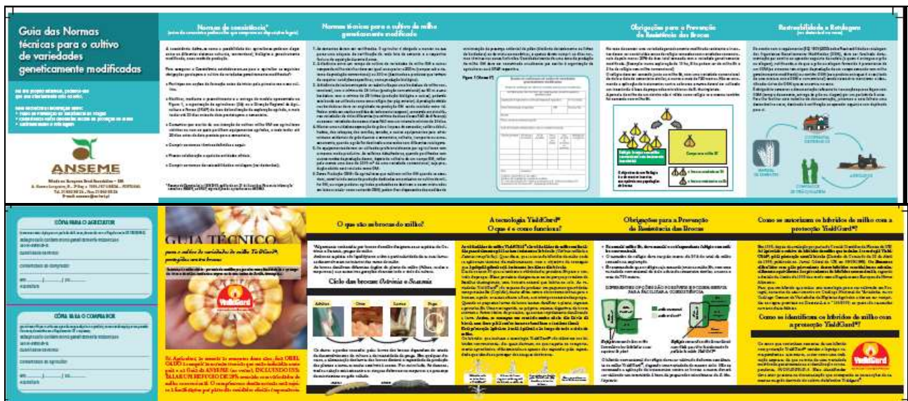
Figura 1: Desdobrável informativo apostado nas embalagens de semente de milho GM

Com o objetivo de identificar de forma inequívoca e fornecer informação sobre as normas nacionais de coexistência aos agricultores, em cada embalagem de semente das variedades de milho geneticamente modificado é apostado um desdobrável informativo, aprovado pela DGAV. Este folheto contém um resumo das regras nacionais aplicáveis ao cultivo deste tipo de variedades, informações referentes às características do OGM e um destacável que pode ser utilizado pelo agricultor para cumprimento das normas de rastreabilidade e rotulagem dos produtos obtidos (Figura 1).