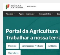
Portal da Agricultura Nova plataforma online