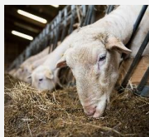
Língua Azul Edital nº 58