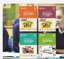
Manuais infantis FAO Desperdício Alimentar