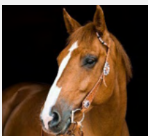
Febre do Nilo Occidental Medidas de controlo