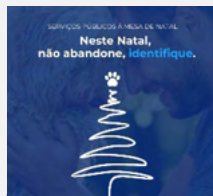
Abandono Animal Campanha para identificação de animais de companhia